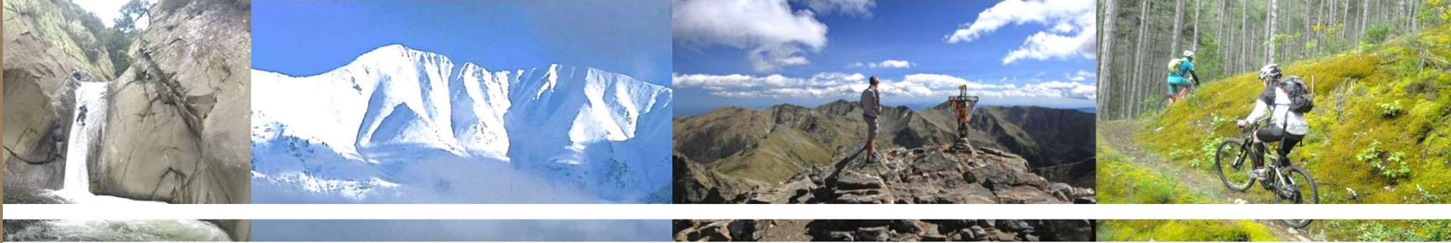
Schéma directeur des activités et loisirs de nature de la destination Canigó - 2014