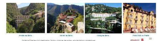
Amélie les Bains, Vertébral-Bains, Nègre-lès-Bains, Près-Vielles-Près